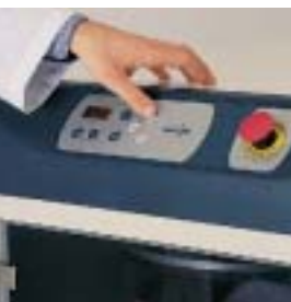
デジタルタイマー