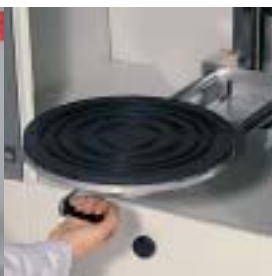
積み下ろしが簡 単な引き出しトレイ