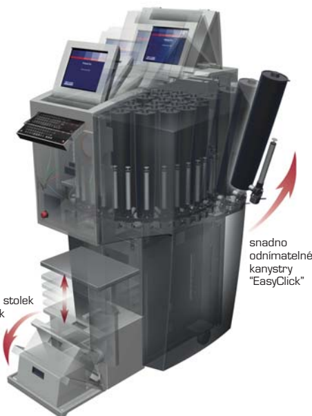
elektrický stůl a schůdek