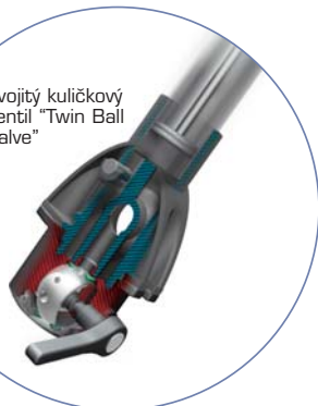
dvojitý kuličkový ventil "Twin Ball Valve"

Modulové provedení umožňuje jednoduchou integraci tiskárny a spektrofotometru. Námí vyvinutý software pro dávkování PrismaPro je průběžně aktualizován s nejnovějšími verzemi Windows.