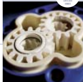
Full Ceramic Pump