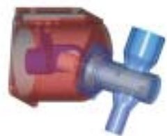
Duraflow VX Pump