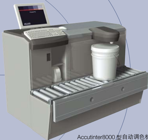
Accutinter 8000 型自动调色机